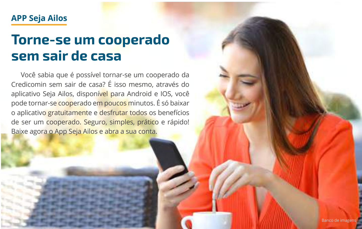
Banco de imagens

Você sabia que é possível tornar-se um cooperado da Credicomín sem sair de casa? É isso mesmo, através do aplicativo Seja Ailos, disponível para Android e IOS, você pode tornar-se cooperado em poucos minutos. É só baixar o aplicativo gratuitamente e desfrutar todos os benefícios de ser um cooperado. Seguro, simples, prático e rápido! Baixe agora o App Seja Ailos e abra a sua conta.